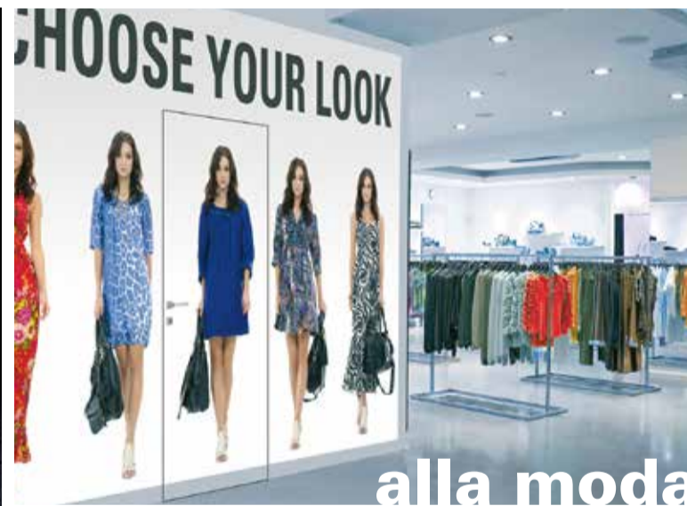
alla moda trendy